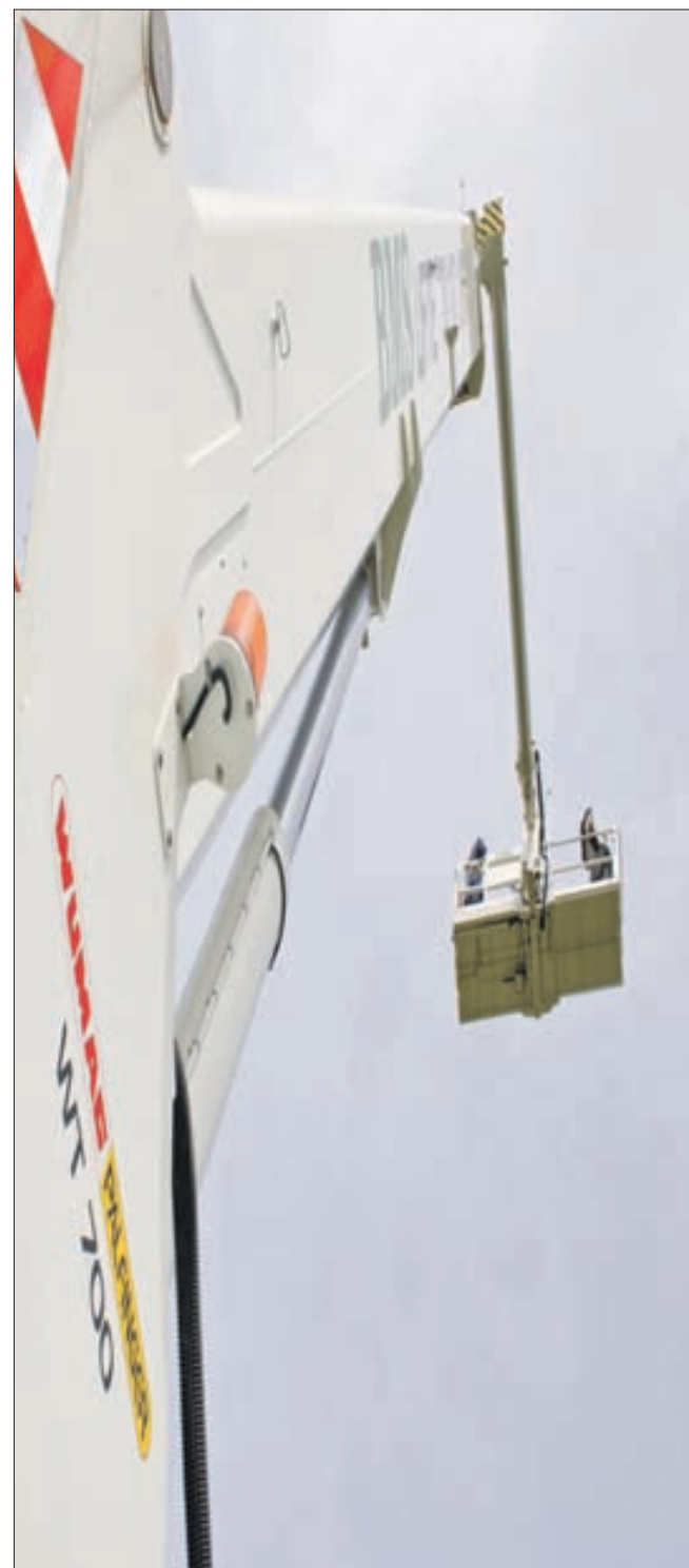
BMS gentager spøgten med at sende udstillingsgæster op i de højere luftlag.

Pleje- og dybdefræsning Ekstensiv fræsning